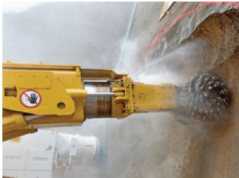
Dieser rotierende Schneidekopf wird den Schlossberg aushöhlen.

Die Ausbruchsarbeiten erstrecken sich bis ins Frühjahr 2017. Das gesamte Ausbruchsvolumen beträgt rund 55 000 Kubikmeter. Ab Sommer 2017 erfolgen die restlichen Betonarbeiten und anschliessend folgt der Innenausbau des Parkings. Marc Imboden