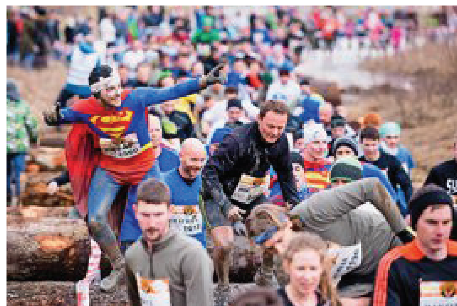
Superman in Bestform: Da bleibt sogar Zeit für eine Pose mitten im Rennen.