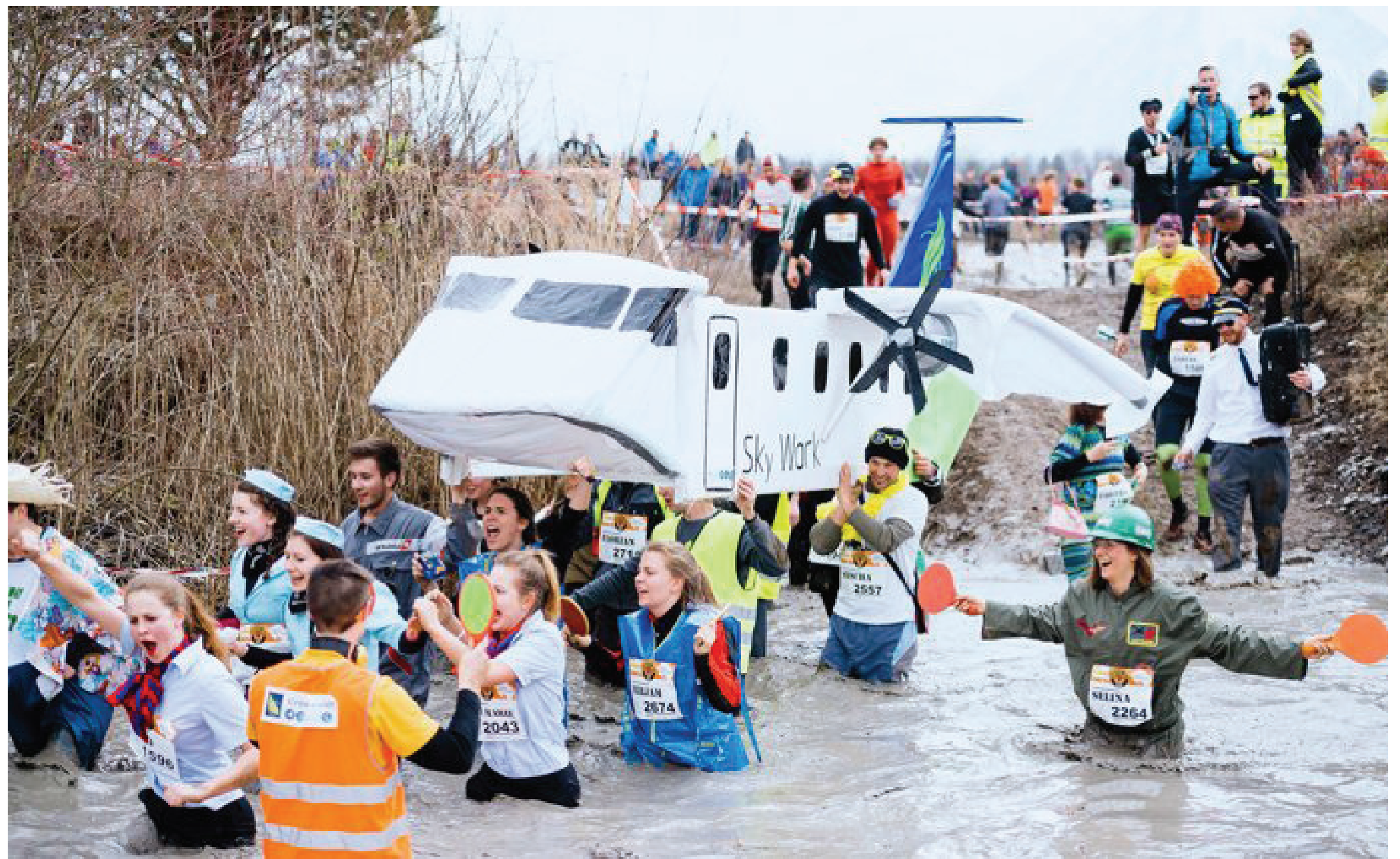
Bei dieser «Fluggesellschaft» stand offensichtlich der Spass und nicht das Siegen im Vordergrund.

Der Stadtratspräsident sowie der Stadtpräsident und ein Gemeinderat liefen gestern gemeinsam durch den Dreck. Sie absolvierten den Survival Run auf dem Waffenplatz Thun. Erfolgreich wie noch nie war der Anlass, es nahmen gegen 3700 Personen am speziellen Laufereignis teil.