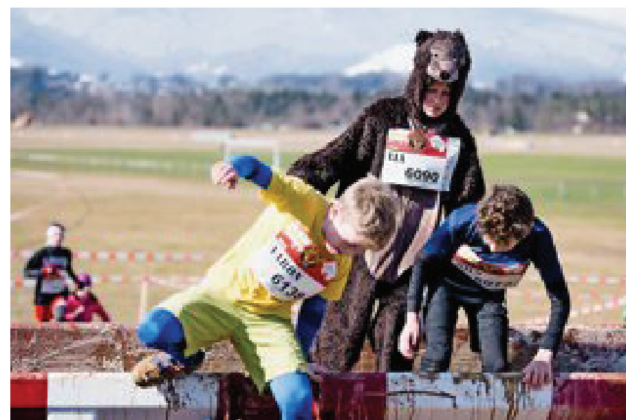
Tierisches Vergnügen: Sogar Bären wagten sich auf den Survival Run auf der Allmend.