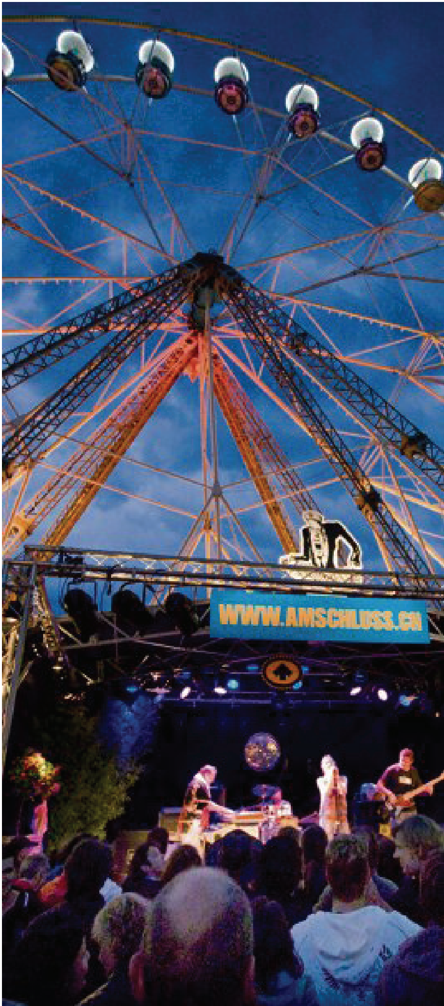
Auch das Festival «Am Schluss» kann von der neuen Regelung profitieren. Die Konzerte dürfen neu bis 23 Uhr dauern. Markus Hubacher

INNENSTADT Während der Sommerferien wird die Sperrstunde an Wochenenden versuchsweise hinausgeschoben. Die Beizer können ihre Gäste nun bis 1.30 Uhr bewirten, und Konzerte dürfen bis 23 Uhr dauern.