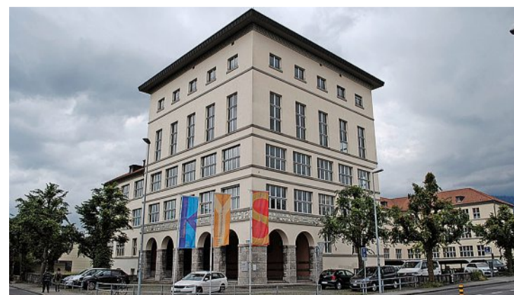
Das Oberstufenschulhaus Progymmatte in Thun. Auch hier wird unter anderem auf Stufe Spez-Sek unterrichtet.

verschieben – was mit 20 zu 18 Stimmen aber abgelehnt wurde. Gegen den Begriff «unvernünftig» verwahrte sich im Namen der Motionäre Ali-Oesch: «Dem Gemeinderat stand es frei, das Thema schon lange vor uns